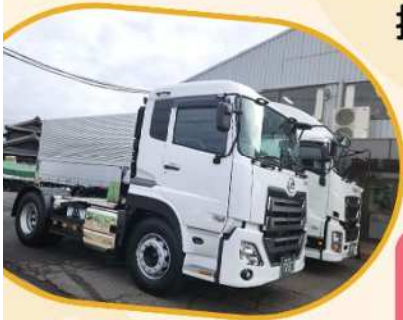
UDトラックス 岡山100き72-27