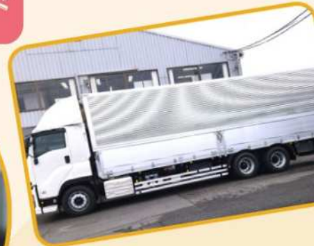
いすゞ自動車 岡山100き72-35